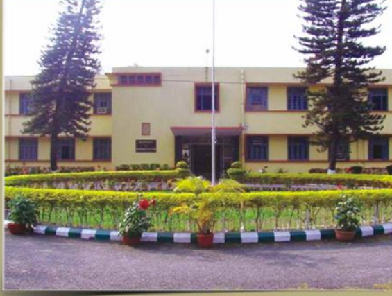
CSR&TI, Berhampore An ISO 9001 : 2008 Certified Institute